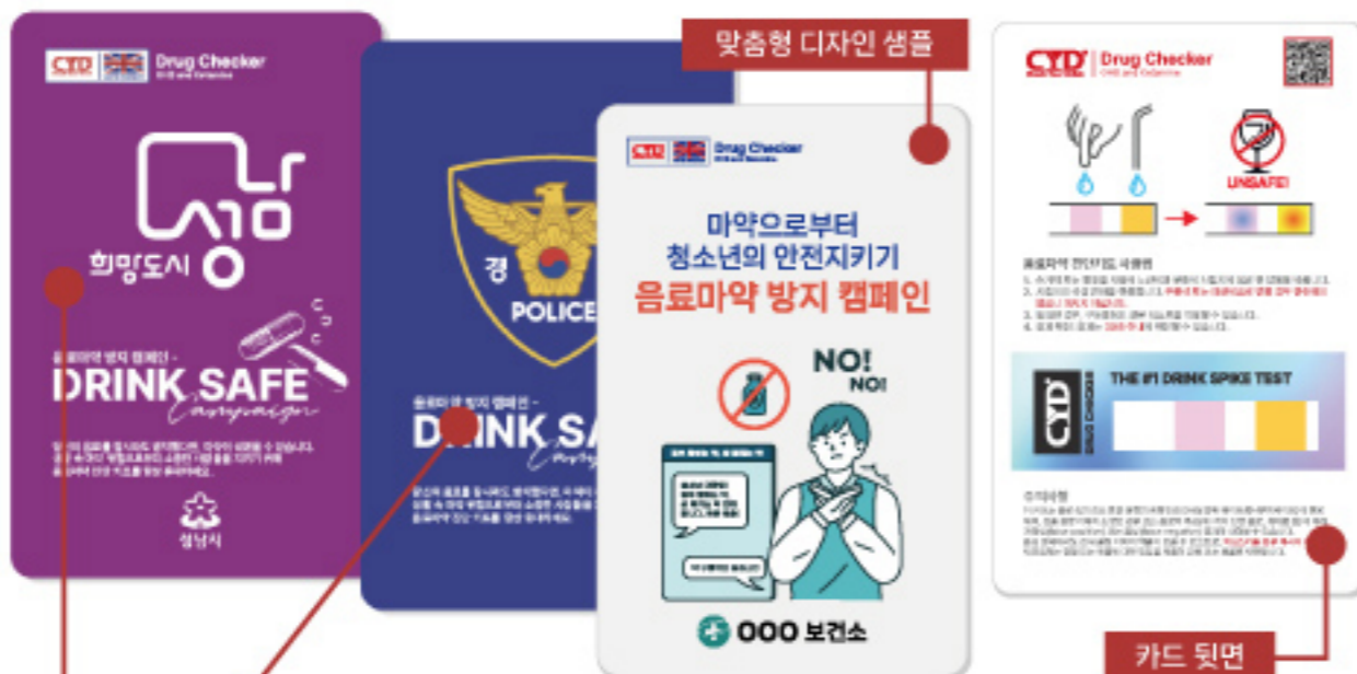
맞춤형 디자인 샘플